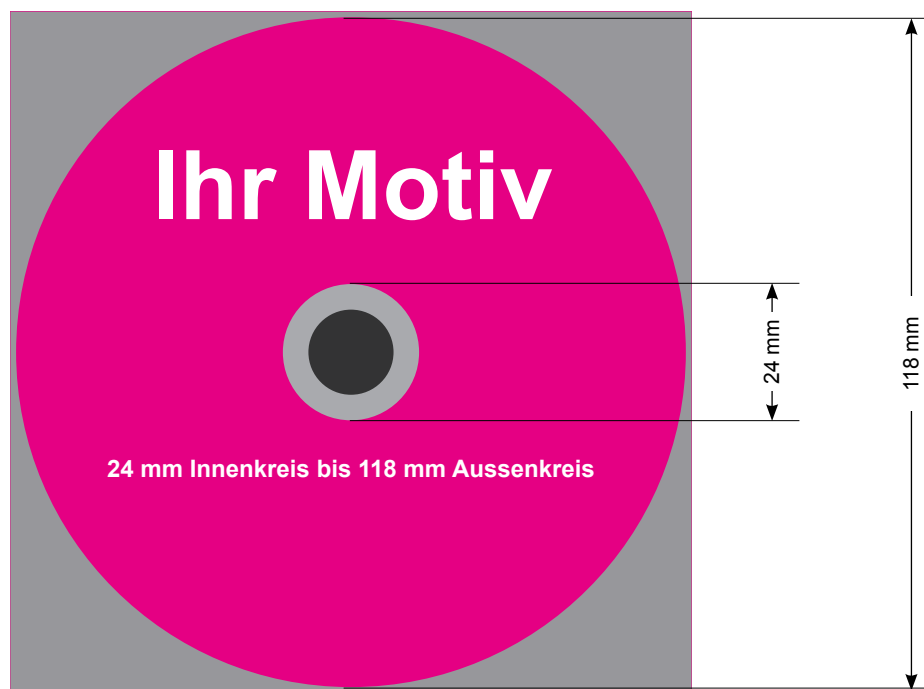
Abbildung 2 Sichtbarer bzw. druckbarer Bereich auf der CD-R/DVD-R