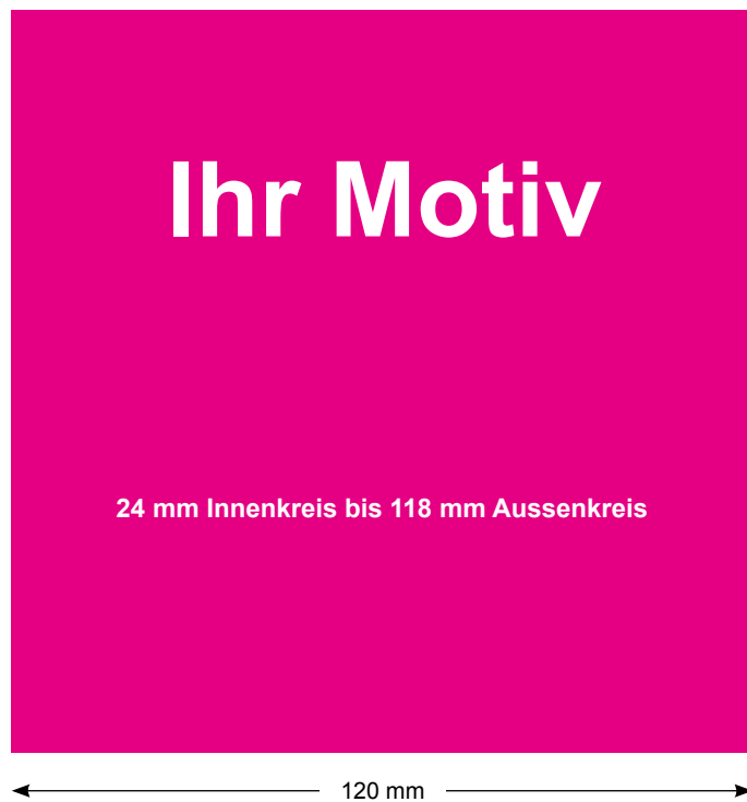
Abbildung 1 Motiv, angelegt mit 120 mm x 120 mm Kantenlänge